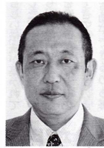
龍ヶ岳中学校教頭