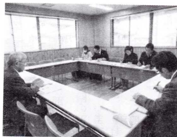
切バスの料金制度が変わり 予算面で心配されました が、各学校の乗り合せ等の 対応により予算内で賄うこ とができました。 最後に、各部の会計担当 の事務職員の先生方にはた いへんお世話になりました。