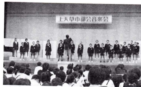
上天草市部会音楽会 生方の熱心な取組みに感謝します。 次年度は、今年度の成果と課題を引き継ぎ、さらなる発展を願っております。

科学展・発明工夫展審査会、毛筆審査会、描画審査会、壁新聞審査会、特別支援学級展については、苓北部会での審査はなく、郡市全体の児童文化部で審査が行われました。また、天草郡市英語発表会が稜南中で今年度は行われました。