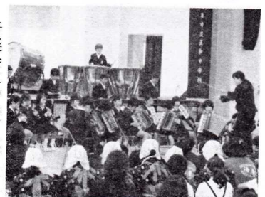
音楽会については、昨年度までは、苓北部会の音楽会を開催して、代表が郡市音楽会に参加していましたが、今年度は、すべての小中学校が郡市音楽会に参加しました。