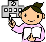
特別支援教育 コーディネーター