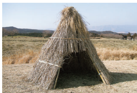
▲草泊まりをするための小屋

Because he had cows, he did kusadomari around the 20th of September every year.