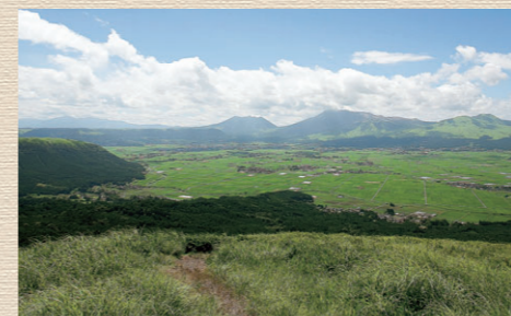
▲大草原と阿蘇五岳

今のように自家用トラックが普及していなかった頃、阿蘇の農家の人々は、高低差300m以上ある採草地まで歩いて行かなければなりませんでした。その時間を節約するために行われていたのが草泊まりです。草泊まりは、昭和40年代頃まで行われていました。