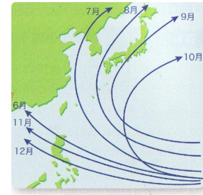
月ごとの台風のおもな進路