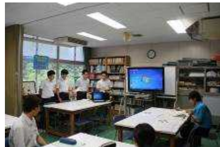
泉支所へのプレゼン