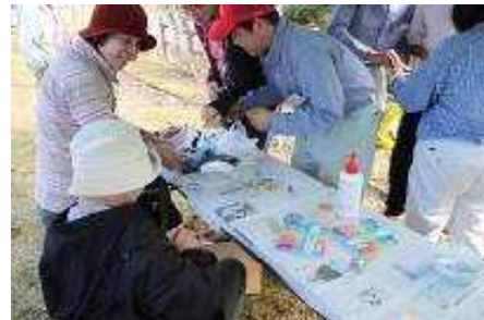
矢山イベント（ネイチャークラフト）