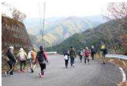
矢山イベント（登山）