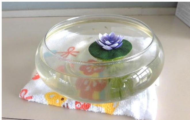
癒し：センターにメダカが泳いでいます