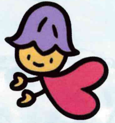
熊本県人権啓発キャラクター コッコロ

県民一人一人に人権尊重の意識が根付き、 全ての人の基本的人権が尊重・保障され、 誰もが幸せに安心して自分らしく生きることができる社会。 そんな社会をつくるために、あなたの力が必要です。 自己実現と幸福追求が満たされる 「人権尊重のまち」を築き上げていきましょう。