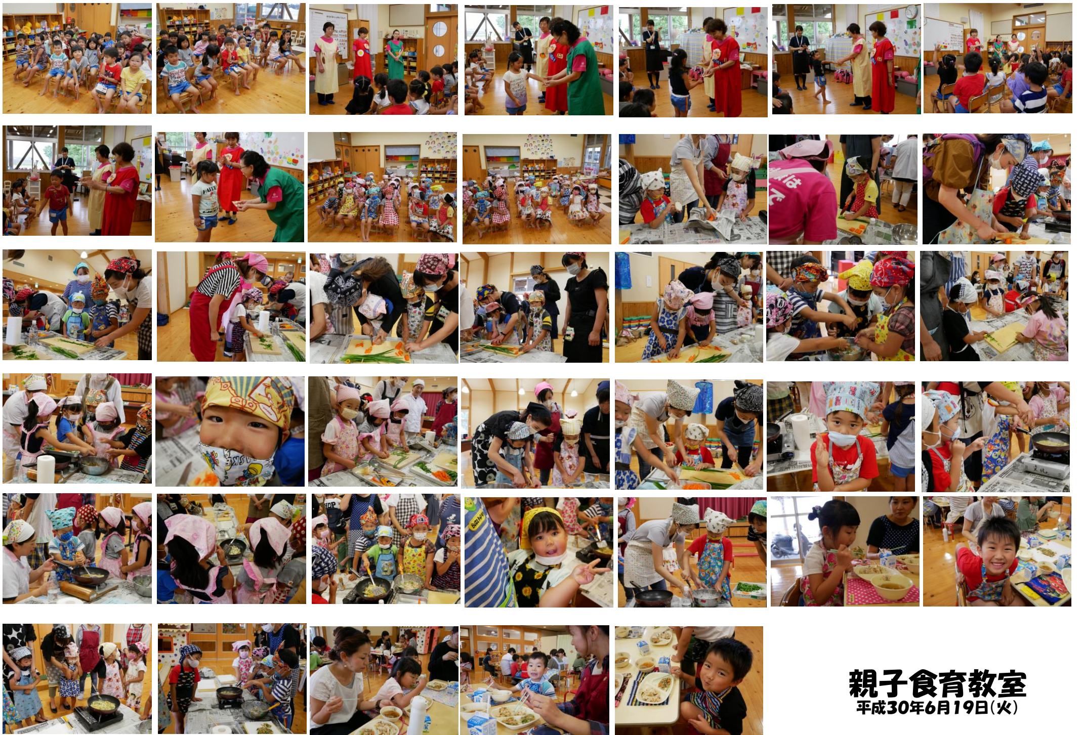
親子食育教室 平成30年6月19日(火)