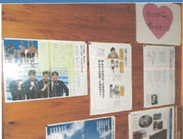
ワークスペースの道徳コーナー