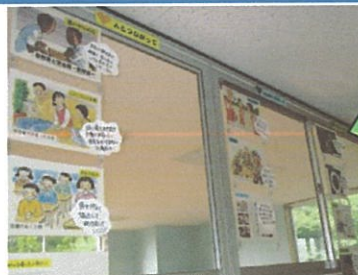
教室の道徳コーナー

学習した教材の挿絵に一言添えて、「道徳ノート」の分類と同じ色ごとに分類して掲示しています。あらゆる場面で振り返ることができます。