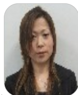
御船町P連母親部長