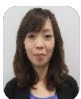
甲佐町P連母親部長