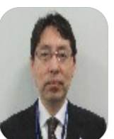
上益城教育事務所