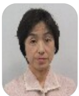
益城町P連母親部長