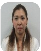
嘉島町P連母親部長