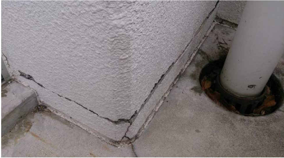
教室ベランダ 立入禁止