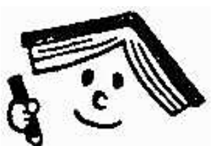
青少年読書感想文全国コンクール イメージキャラクター おほんちゃん