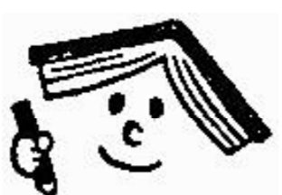
青少年読書感想文全国コンクール イメージキャラクター おほんちゃん