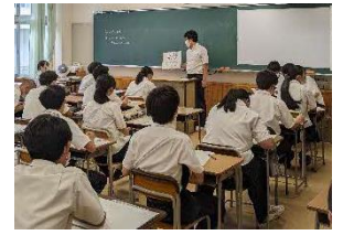
探究活動中間発表