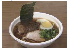
天草の雑節や天草大王からダシをとった「牛深ラーメン」