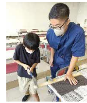
地元小学生に木材加工を教える木工教室