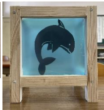
小国の木材を利用したランタン