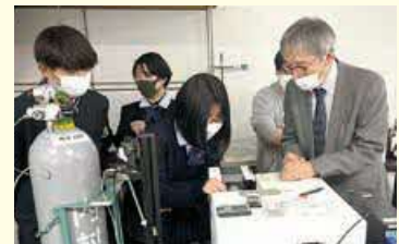
大学施設での測定や実験手法に関する指導・助言を受けます。