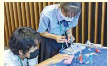
令和4年度に第二高校が実施したKMバイオロジクス訪問の様子。