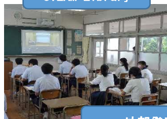
外部発表会の見学