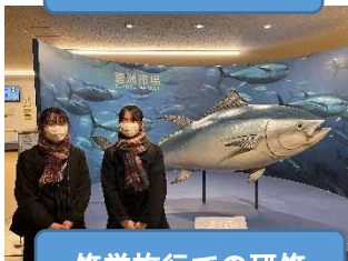
修学旅行での研修