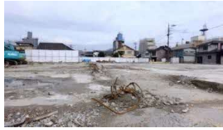
3年経っても中心部は更地