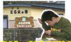
障がい者支援施設