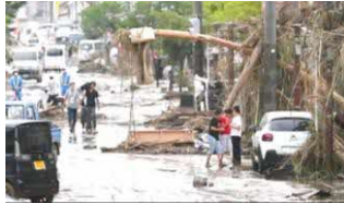
令和2年7月豪雨災害

令和2年7月豪雨災害で、私たちの住む人吉球磨地域は壊滅的な被害を受けた。店舗やビルが解体され、多くの土地が更地になった。元々、事業主だった方も高齢のため、災害をきっかけに廃業され、更地のまま3年経ってしまった。SDGsの目標11には「住み続けられるまちづくりを」という目標が掲げられている。私たちはSDGsの視点で「エシカル商品」を開発することで、豪雨災害の復興支援に取り組むと考えた。エシカル商品とは、「環境、人権、地域の持続可能性」などに配慮・貢献する商品である。