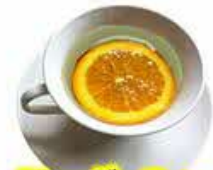
フレーバーティー