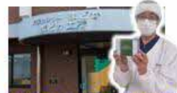
障がい者支援施設