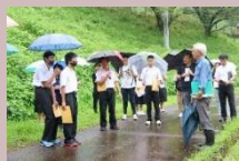
くねぶ生産組合長のお話