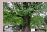
県指定天然記念物 宮園の大イチョウ