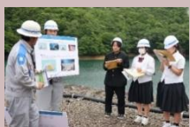
内谷ダムで九州電力のお話