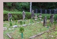
村指定文化財 「びやーどん」の墓