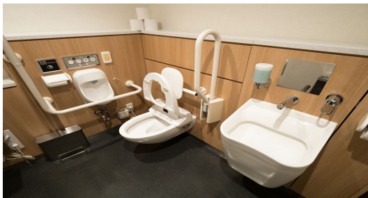
引用：PRESIDENT Online 富樫 正義

現在の日本社会は、障害者と健常者の壁を作っているのではないかと感じる。その壁を感じるものの一つとして「トイレ」が挙げられる。