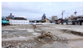
3年経っても中心部は更地