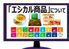
「エシカル商品」について