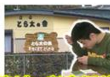
障がい者支援施設