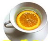
フレーバーティー