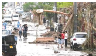
令和2年7月豪雨災害

令和2年7月豪雨災害で、私たちの住む人吉球磨地域は壊滅的な被害を受けた。店舗やビルが解体され、多くの土地が更地になった。元々、事業主だった方も高齢のため、災害をきっかけに廃業され、更地のまま3年経ってしまった。SDGsの目標11には「住み続けられるまちづくりを」という目標が掲げられている。私たちはSDGsの視点で「エシカル商品」を開発することで、豪雨災害の復興支援に取り組むまいと考えた。