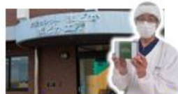
障がい者支援施設