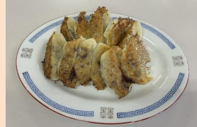
『ジビエギョウザ』開発