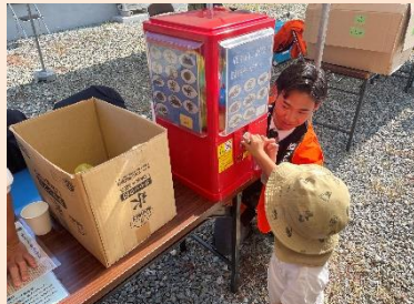
最新設備「レーザー加工」 『キーホルダー販売』