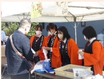
企業コラボ開発製品 『餃子・チョコ福』販売