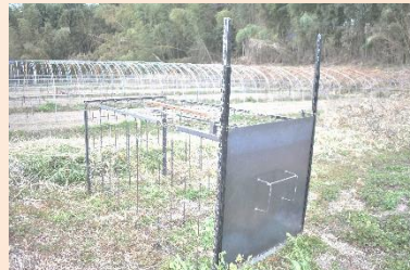
箱罾設置（合計3台目）