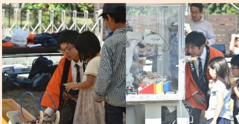
『ロボット操縦・体験』 最新設備『産業用ロボット』