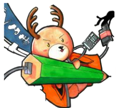
イメージキャラクター「こまちゃん」