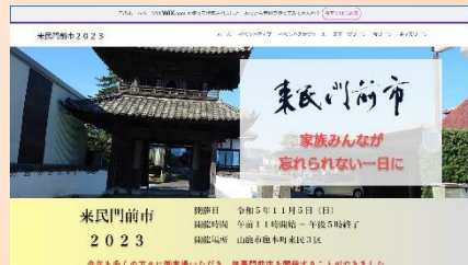
スマホで情報発信 『ブース紹介HP開設』