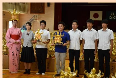
贈呈式の写真（中央は山鹿市長）

4年ぶりに開催された「山鹿灯籠まつり」で使用する灯籠のLEDを山鹿市観光課の依頼により製作した。「ゆらぎ」LEDにより、本物のろうそくの炎のように見せ、幻想的な光を実現した。今年度は120機を予定とし、数年かけて合計1000機の納入を計画している。