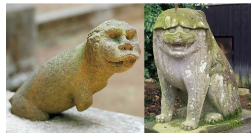
熊野神社(左)・小幡八幡宮(右)