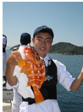
天草灘での釣獲実習