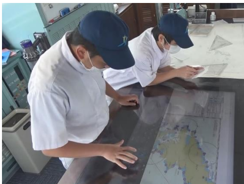
海図と電子チャートによる位置記入