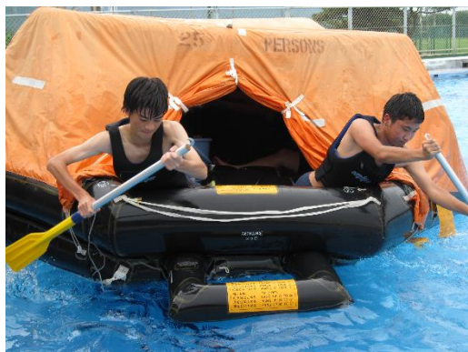
膨張式救命いかだによる脱出訓練