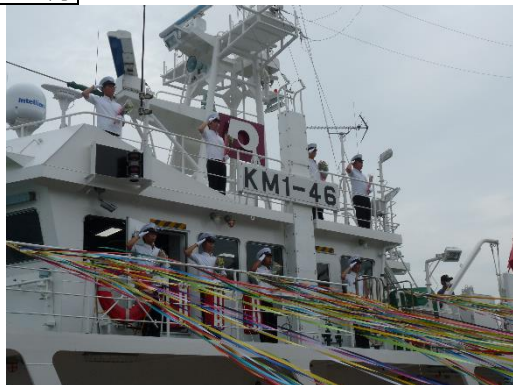
大海原へ向けての出港式