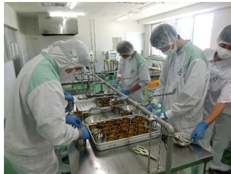
牛深産のキビナゴの缶詰実習