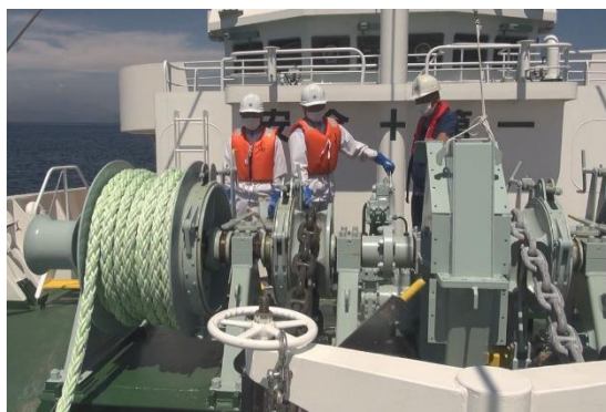
アンカーの揚錨・投錨作業